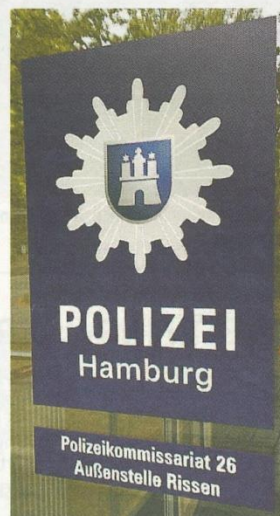
Ein großes Schild weist auf die neue Station hin.